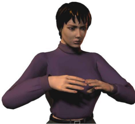
Optimale werkhoogte voor knippen: tussen borst en schouderhoogte

De kapper verricht bij het werken aan de pompstoel de vaktechnische handelingen tussen borst en schouderhoogte met de schouders én ellebogen ontspannen laag hangend. Bij uitzondering mag de kapper hoger (tot ooghoogte) knippen.